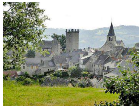
Village de Sénergues

On trouve aussi à Sénergues une église dédiée à Saint Martin, de même qu'un château construit à la fin du XVI ème siècle. C'est une vaste demeure seigneuriale aux fenêtres triflées.