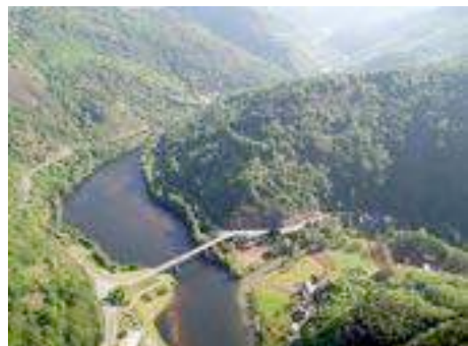
Vallée du Dourdou