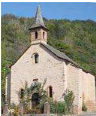
Chapelle Dadon à Grand Vabre

Pourquoi en ces lieux ? Rien de précis sur ce point, sauf que la légende et les chroniques concernant Dadon, l'ermite à l'origine du monastère de Conques, font état d'une retraite en ce lieu de solitude et de calme où il fonda Grand Vabre. Cet événement de l'histoire du village remonte au VIII ème siècle, époque où Dadon se retire de la vie en communauté pour une vie de méditation.