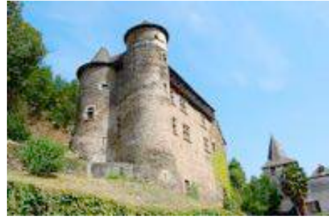
Château de Vieillevie

Ce charmant village de la vallée où se tenaient jadis des foires aux porcs et chevaux renommées s'étend au pied de son remarquable château des XV ème et XVI ème siècles avec hourds en bois. La petite église romane est ornée de chapiteaux historiés et de fenêtres à double arcature. A proximité de Vieillevie, sur la rive gauche du Lot, Montarnal est bâti au pied de son ancienne forteresse (XIII siècle) dont il subsiste une tour ronde décapitée. Dans ce hameau résidaient jadis les gabelous qui faisaient la chasse aux contrebandiers.