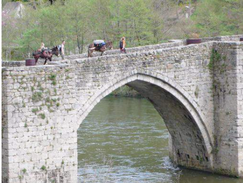
Traversée du pont vers Entraygues

Entraygues , « entre les eaux » comme son nom l'indique en occitan, se situe au confluent du Lot et de La Truyère. Entraygues aurait été fondée au milieu du X ème siècle. Le bourg a conservé des ruelles à caractère médiéval , des maisons des XV ème et XVII ème siècles, certaines à colombages et encorbellement.