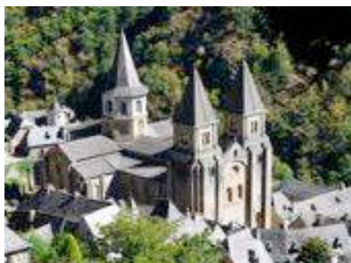
Abbaye de Conques

La vue de Conques est saisissante pour qui vient de l'ouest. Lové sur le flanc de la colline boisée qui apparaît devant le marcheur sur la rive opposée du Dourdou, ce magnifique village médiéval expose ses gradins de toits en lauses où dominent les trois tours de la basilique Sainte Foy.