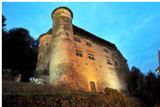
Chateau de Vieillevie

Notre aire de bivouac est située à quelques mètres de la rivière du Lot qui traverse Vieillevie.