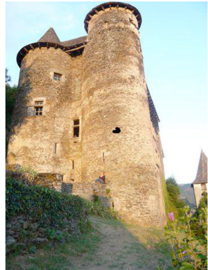
Château de Vieillevie

Notre aire de bivouac est située à quelques mètres de la rivière du Lot qui traverse Vieillevie.