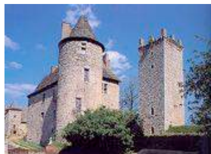
Château de Sénergues

On trouve aussi à Sénergues une église dédiée à Saint Martin, de même qu'un château construit à la fin du XVI ème siècle. C'est une vaste demeure seigneuriale aux fenêtres triflées.