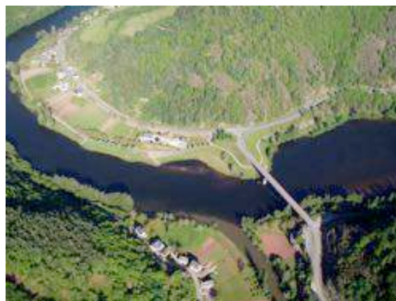
Vallée du Dourdou

Votre dernière journée vous fera marcher sur les pas de Dadon, ce moine bénédictin à l'origine du monastère de Conques. Selon la légende, ce sentier chevauchant monts et vallées en bordure du Dourdou serait celui qu'aurait emprunté l'ermite pour se retirer à Grand Vabre.