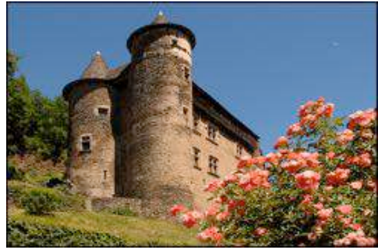
Chateau de Vieillevie

Notre aire de bivouac est située à quelques mètres de la rivière du Lot qui traverse Vieillevie.